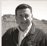
ROBERTO GIACOBBO Conduttore di VOYAGER, Rai 2