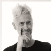
VINCENZO SCHETTINI Divulgatore scientifico, youtuber e conduttore televisivo