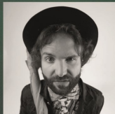
BARBASCURA X Divulgatore scientifico, scrittore, youtuber e conduttore televisivo